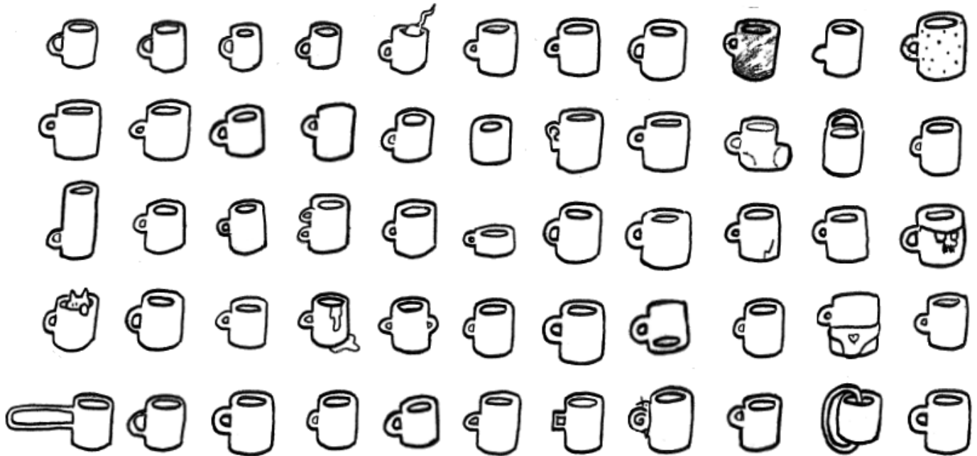
Dessin réalisé par les soeurs kif-kif pendant la création de Département des Retours

une grosse différence avec les autres. Tes amis peuvent-ils trouver cette erreur de fabrication dans ton dessin? Peux-tu rajouter d'autres petites différences à travers les objets identiques? Lequel est ton préféré? Souvent on aime les objets qui ont des défauts parce qu'ils sont uniques!