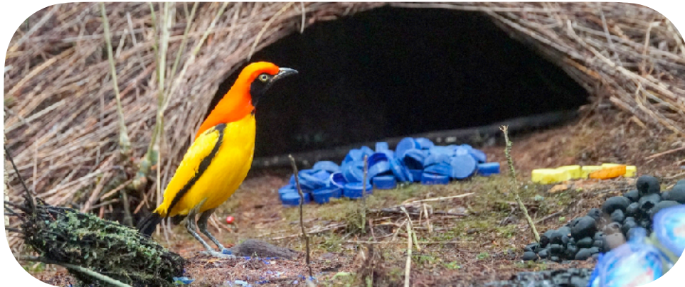
Un oiseau jardinier devant sa collection

Les humains achètent parfois des objets qui ne servent à rien, juste parce qu'ils les trouvent beaux. Mais ils ne sont pas les seuls animaux à le faire! Les oiseaux jardiniers accumulent eux aussi des objets en apparence inutiles juste parce qu'ils les trouvent beaux. Ils les placent en les agençant par couleur et quand ils ont fini, il font une petite danse devant. Comme cela, ils espèrent être aimés ou admirés!